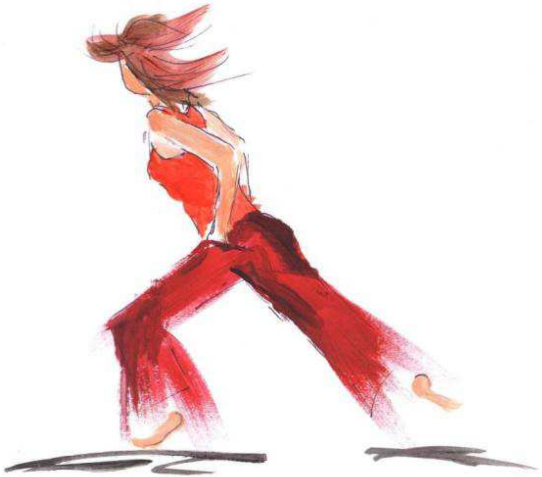
Illustration für Praxis für Berufswegberatung, Barbara Mathlage, Langenfeld