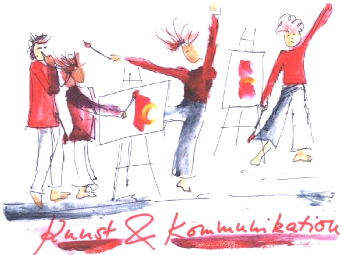
Illustration für eigenen Workshop