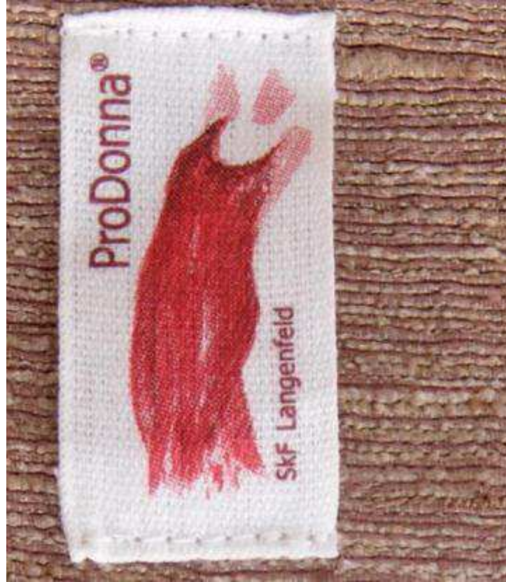
Bild für Label ProDonna®- SkF Langenfeld Upcycling – Projekt (handgefertigte Taschen, Kleidung...)