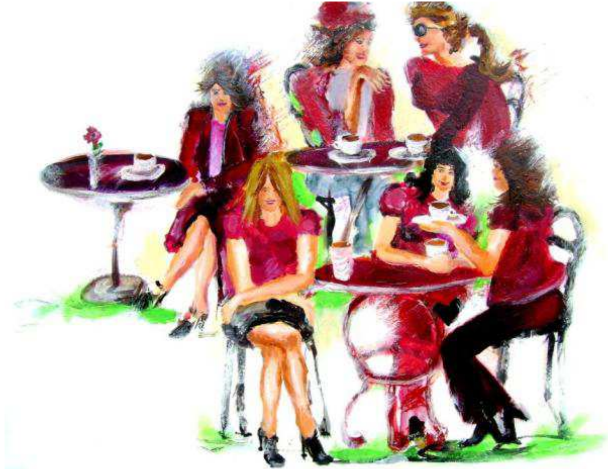
Bild für Broschüre, Veranstaltungsreihe „Café Feminin“, Stadt Langenfeld, Gleichstellungsstelle