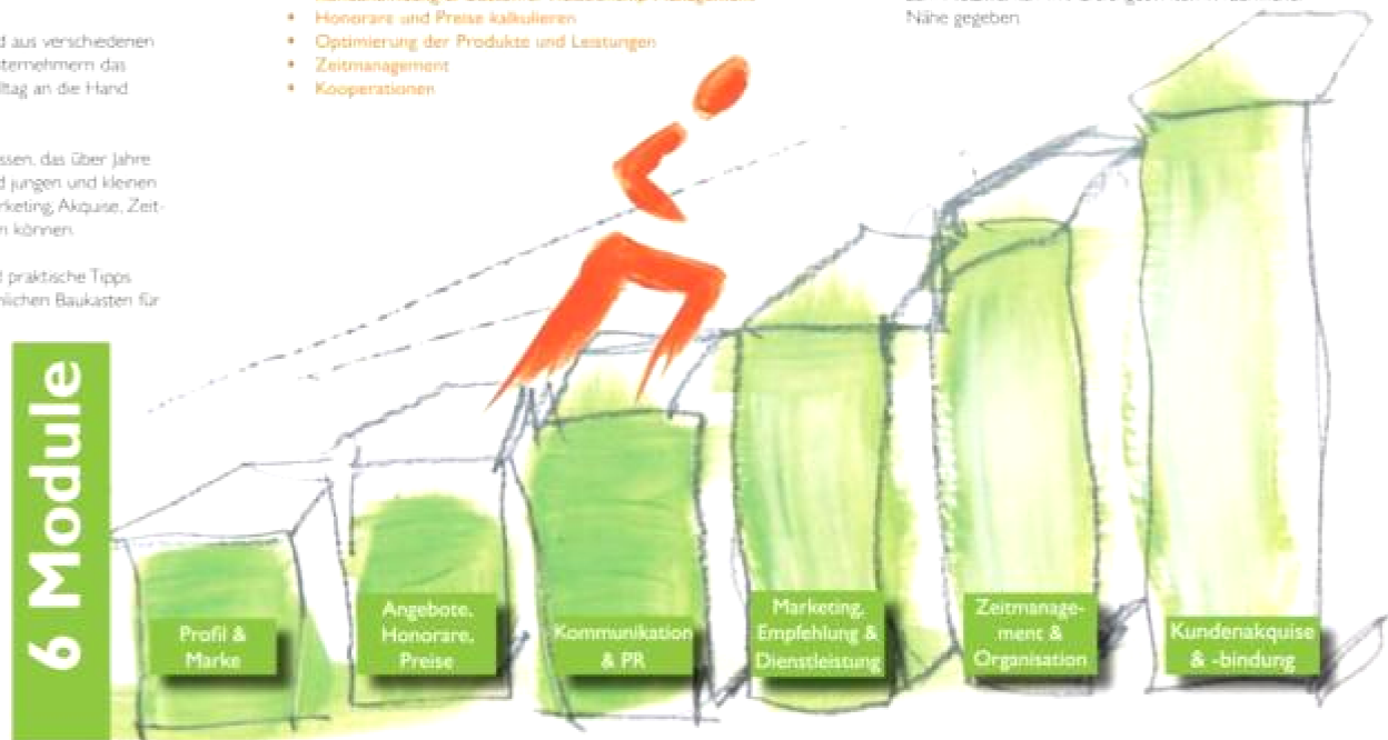
Bild für Broschüre „Forum für junge Unternehmen“, Barbara Mathlage und Ute Stern, Design Gabriele Randerath, Leverkusen